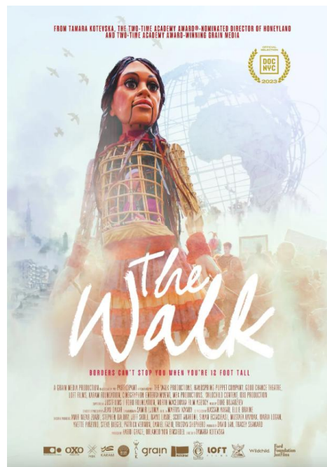
Figure 10. Affiche du film documentaire The Walk , réalisé par Tamara Kotevska, retraçant le projet artistique et humain autour de la marionnette Amal [KOT 24]

Le documentaire a suscité un large débat international, révélant les contradictions politiques contemporaines, notamment à travers la polémique soulignant la facilité avec laquelle une marionnette peut traverser des frontières, alors que des enfants réels, porteurs des mêmes histoires de souffrance et d'exil, se heurtent à des obstacles administratifs et humains insurmontables. « D'une saisissante beauté, mené de main de maître, le récit du voyage d'Amal mêle intensément profonde humanité -il suffit de quelques séquences pour que la marionnette n'en soit plus une à nos yeux- et réquisitoire d'autant plus féroce qu'il est silencieux » [KOT 24]. Cette approche cinématographique renforce la portée critique et symbolique du projet, tout en confirmant le rôle central du numérique dans la construction et la diffusion d'un récit artistique engagé à l'échelle mondiale.