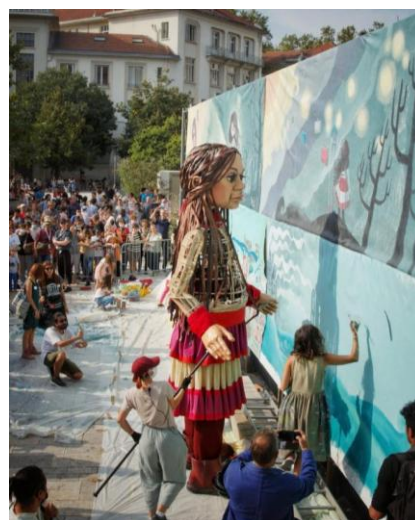
Figure 6 et 7. Activités artistiques de la marionnette Amal dans les espaces publics : performances, ateliers et interventions scéniques révélant l'hybridation entre artisanat, création collective et innovation technique [HAS 21, 21c]