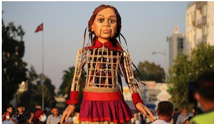
Figure 1. La marionnette géante Little Amal : une figure contemporaine de l'artisanat marionnettique à grande échelle, intégrant savoir-faire manuel et dispositifs technologiques d'assemblage [21B]

Amal est porteuse d'espoir et de tendresse, invitant le spectateur à une expérience de partage, de réflexion et d'exploration. La marionnette s'ouvre alors à des éléments de fascination inscrits dans sa conception, ses costumes, ses caractéristiques et ses couleurs, provenant d'une imagination collective qui reconfigure son être sous une autre forme, mettant en valeur certaines caractéristiques et en obscurcissant d'autres, pour devenir un instrument de compensation pour ce que la réalité omet, appauvrit ou efface [JAE 21; KEN 25].