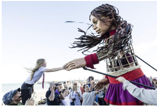
Figure 3 et 4. Interaction sensorielle et motrice de la marionnette Amal : coordination entre manipulation humaine, mécanismes assistés et perception corporelle dans l'espace public [KEL 23]

La liberté de mouvement de la marionnette Amal est amplifiée par des innovations techniques qui allègent sa structure et facilitent ses mouvements. De plus, la marionnette intègre des systèmes de connexion télécommandés, permettant de contrôler à distance les mouvements de ses yeux, ce qui renforce son réalisme et son interaction avec le public. Cette approche hybride illustre l'émergence d'une nouvelle forme d'art, où les technologies robotiques se mêlent à la conception et à l'animation de figures dramatiques, un domaine relativement récent des arts du spectacle [FEN 17 ].