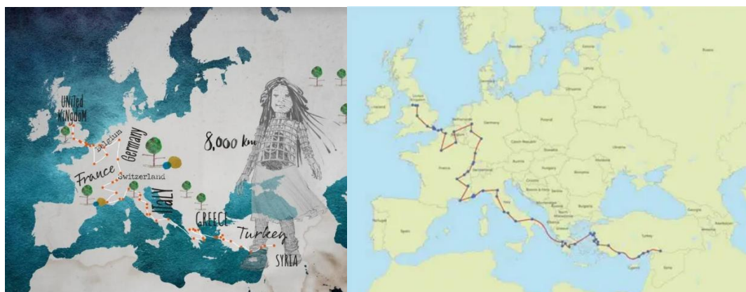
Figure 2. Cartographie du parcours international de la marionnette Amal, illustrant la dimension transnationale du projet The Walk et la coopération entre acteurs artistiques, techniques et institutionnels [GOO 22].

Le voyage commence à la frontière syro-turque et s'achève à Manchester, au Royaume-Uni [SAL 21]. Débutée le 27 juillet 2022, la marche s'est terminée le 3 novembre de la même année. Ce jour-là, Amal a fêté son dixième anniversaire lors d'une réception spéciale au Festival international de Manchester, un événement artistique pluridisciplinaire dédié aux arts contemporains, qui réunit des créations en théâtre, danse, musique et arts visuels [JAE 21 ; HAN 20 ; ZUA 21]. Tout au long de son périple, la marionnette Amal a traversé les rues de 70 villes et grandes agglomérations européennes [MUR 21]. À chaque étape, elle a suscité un vif intérêt auprès du public. Les spectateurs ont interagi avec cette scénographie unique et avec la cause qu'elle représente [ROK 13] : la souffrance des populations déplacées à travers le monde, et plus particulièrement celle des enfants contraints par la guerre et les conflits de quitter leur patrie à la recherche d'un lieu sûr et digne.