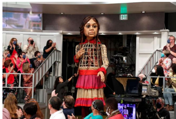
Figure 8 et 9. Stratégies de médiatisation du projet Amal : la marionnette géante dans les dispositifs de communication culturelle, notamment lors de son apparition dans l'émission télévisée The View , diffusée le 28 septembre 2022 [ROS 22]

Dans ce projet, la technologie, déployée selon différents modes de fonctionnement, est à la fois fonction, argument promotionnel et méthode de diffusion [GOM 25]. Elle fait partie intégrante de la beauté et du symbolisme du projet. Elle transcende la neutralité du monde pour s'engager dans l'art et le mouvement, la technologie numérique ouvrant de nouvelles perspectives sur ses usages. The Walk propose des perspectives philosophiques, scientifiques et artistiques sur la technologie. Il démontre comment les outils numériques liés à la communication et au marketing culturel, peuvent favoriser la circulation mondiale d'une œuvre sans en altérer la dimension humaine et symbolique [HES 06]. La documentation médiatique et la publication numérique ont ainsi transformé la présentation scénique en une production audiovisuelle, qui génère une aura numérique autour du projet [HEI 83]. Cette aura prolonge l'expérience directe de la performance et la reconfigure, en assurant sa traçabilité et sa réappropriation par différents publics et contextes culturels.