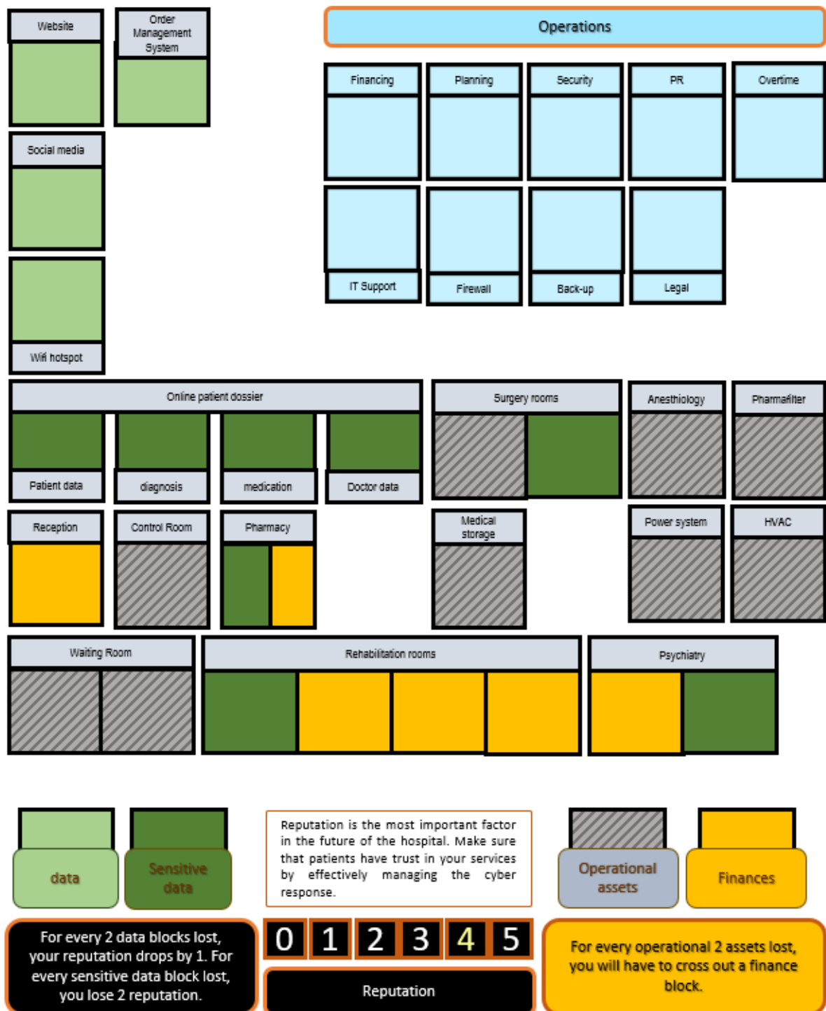
Figure 1. Microjeu Gestion Hospitalière - page de couverture.

Le format du jeu se compose d'une feuille A4, présentant la configuration avec les éléments respectifs suivants :