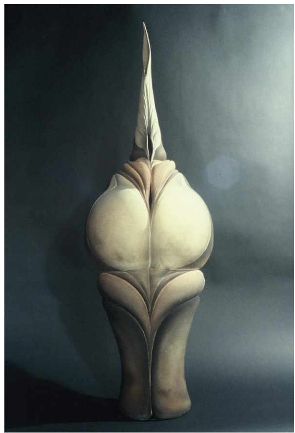
4. Sans titre, raku, tournée, 1982, 141x48x48 cm.