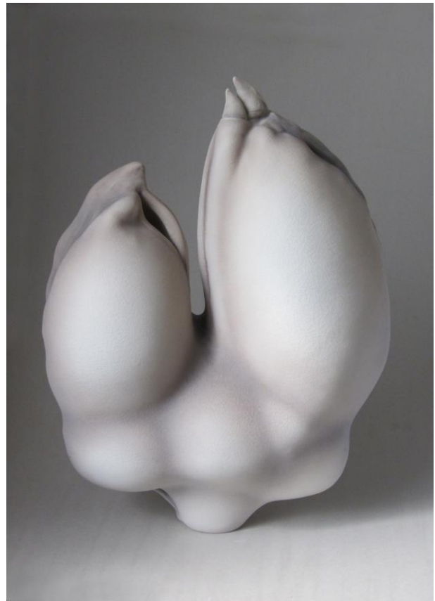
9. Sans titre, porcelaine, 4469, 2016, 63x46x18cm