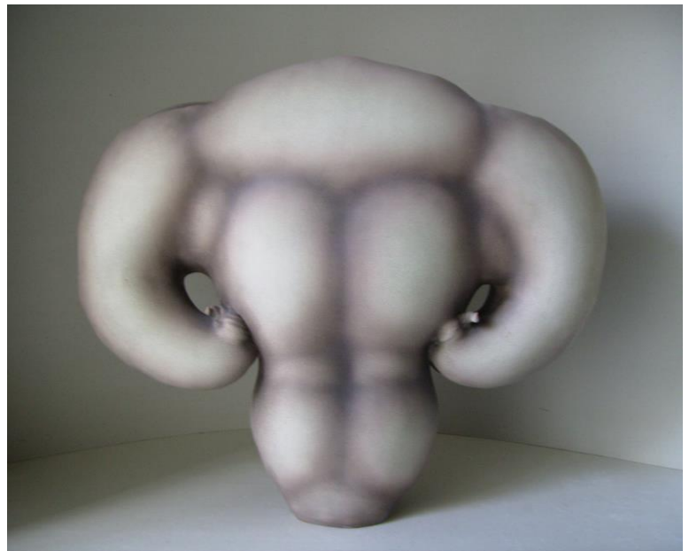
6. Sans titre, porcelaine, 1989, 56x70x24 cm