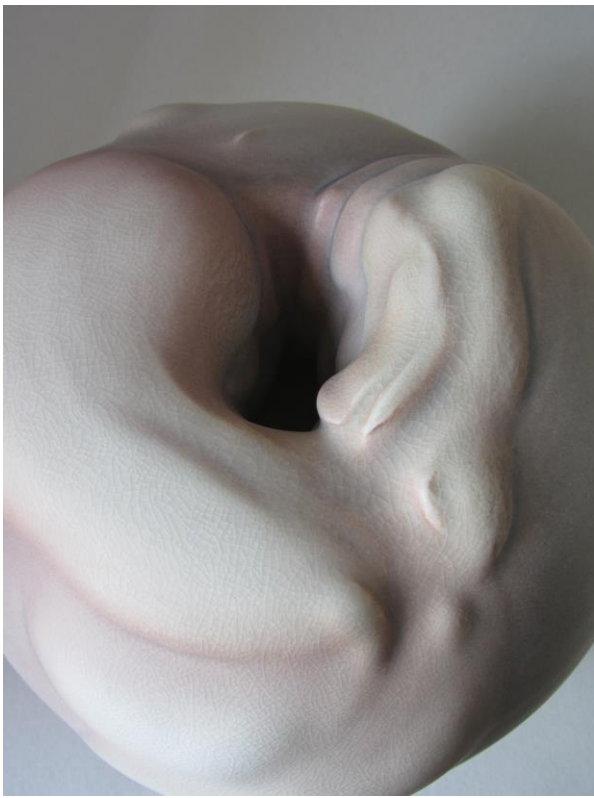
13. Sans titre, porcelaine, tournée, 2006, 35x27x27