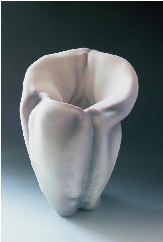
8. Sans titre, 2003, Centre mondial de la céramique d'Icheon (Corée du sud), 4 x42x31cm