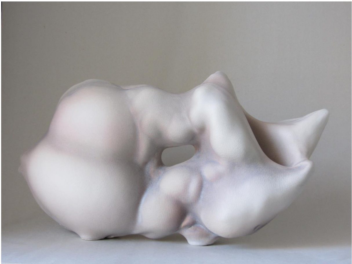
10. Sans titre, porcelaine, 2008, 29x53x15 cm