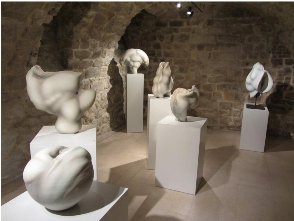
2. Exposition à la Galerie Silbereis 2013, Paris. On peut voir en bas à gauche une pièce appartenant au musée national de céramique de Sèvres (pièce récompensée en 2012 par le prix Liliane Bettencourt pour l'intelligence de la main) et au centre une pièce appartenant au musée national Adrien Dubouché (Limoges).