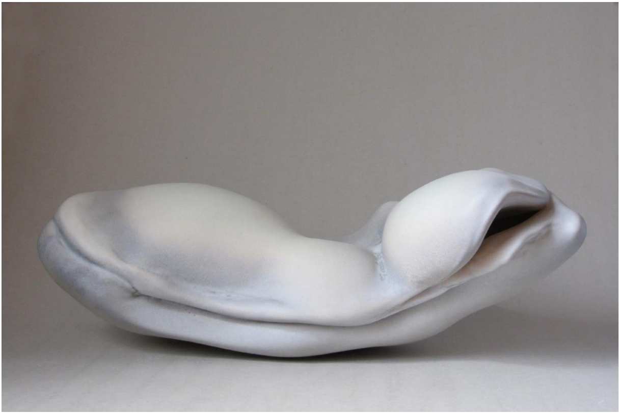
7. Sans titre, porcelaine, 2006, 18x50x26 cm