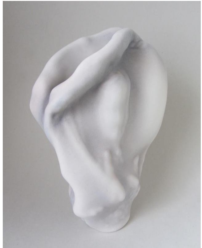
12. Sans titre, 2018, 43x31x16 cm