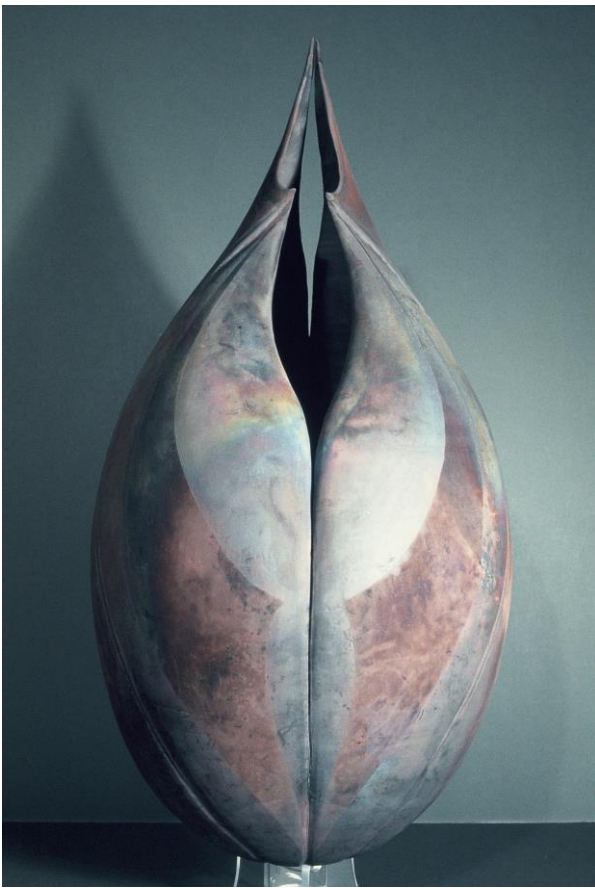
3. Sans titre, raku, tournée, 1978, 56 cm.