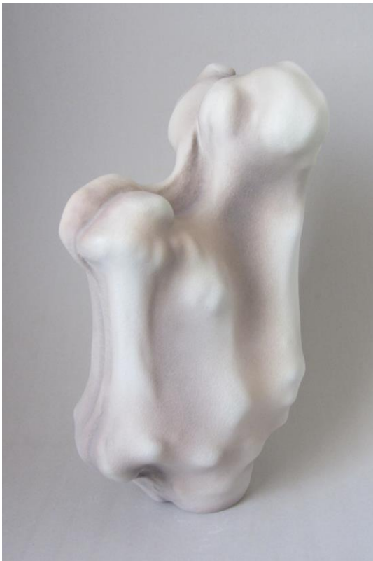
11. Sans titre, porcelaine, 2017, 40x34x18 cm