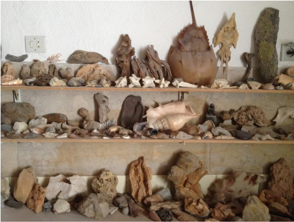
1. Collection de formes organiques, atelier de l'artiste