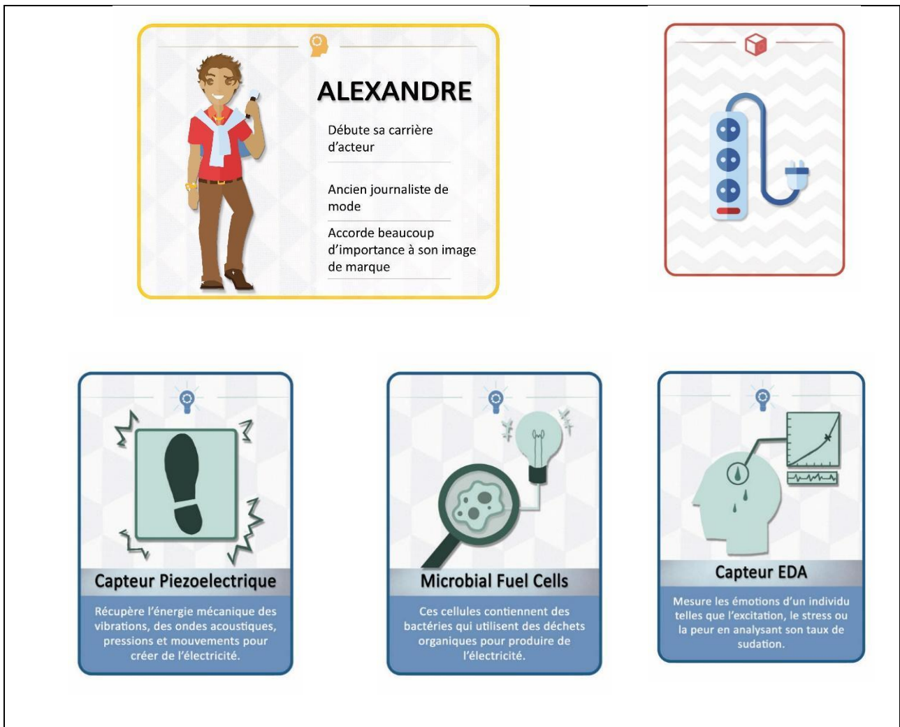
Figure 2. Exemples de cartes du jeu Tech it !

Dans ce cas, la condition du test était la suivante : Alexandre est un jeune homme vivant en ville. Il est un grand fan de soin de son image personnelle, de la manière dont il s'habille et passe du temps sur les réseaux sociaux. Il est confronté à un problème : en raison d'une utilisation intense, son téléphone se recharge très rapidement. Que peut-on faire pour l'aider ? En groupes de six, ils discutent des idées proposées et en choisissent une. Toutes les idées sont collectées pour évaluer le résultat créatif du travail de chaque étudiant. Tous les participants à l'étude disposent des mêmes éléments pour l'idéation.