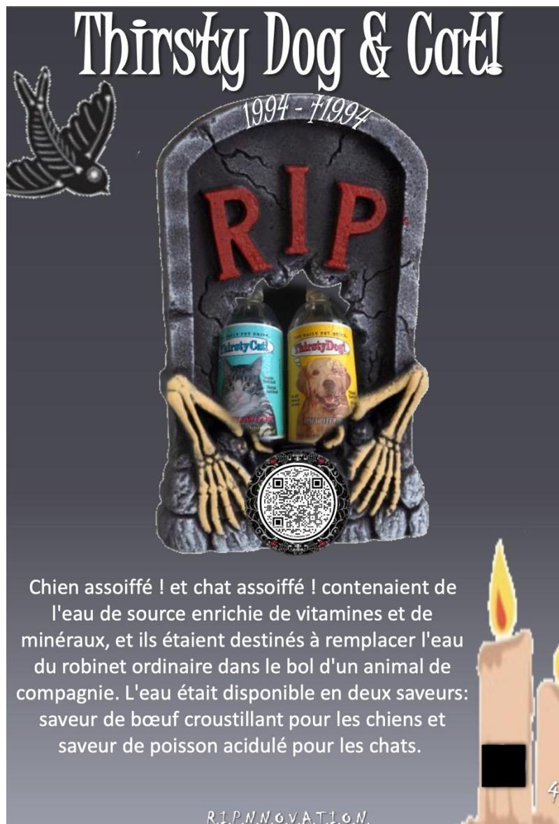
Figure 3. Exemple de fiche du jeu R.I.P.N.N.O.V.A.T.I.O.N